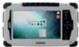
ALGIZ 7 Super-rugged, ultra-mobile