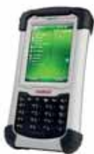
NAUTIZ X7 Ahead of the curve